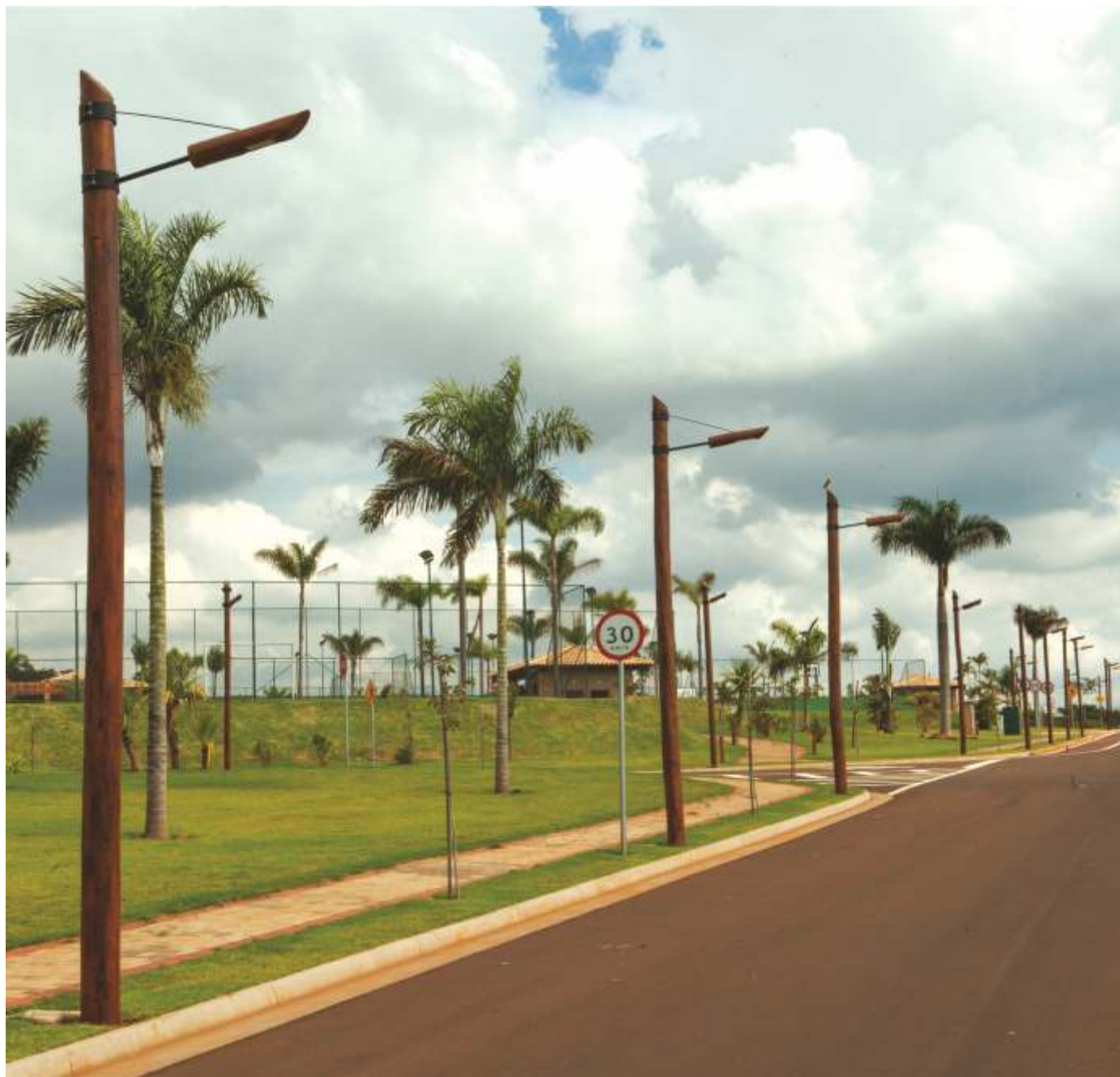
Resort S. Carlos - São Paulo, Brasil